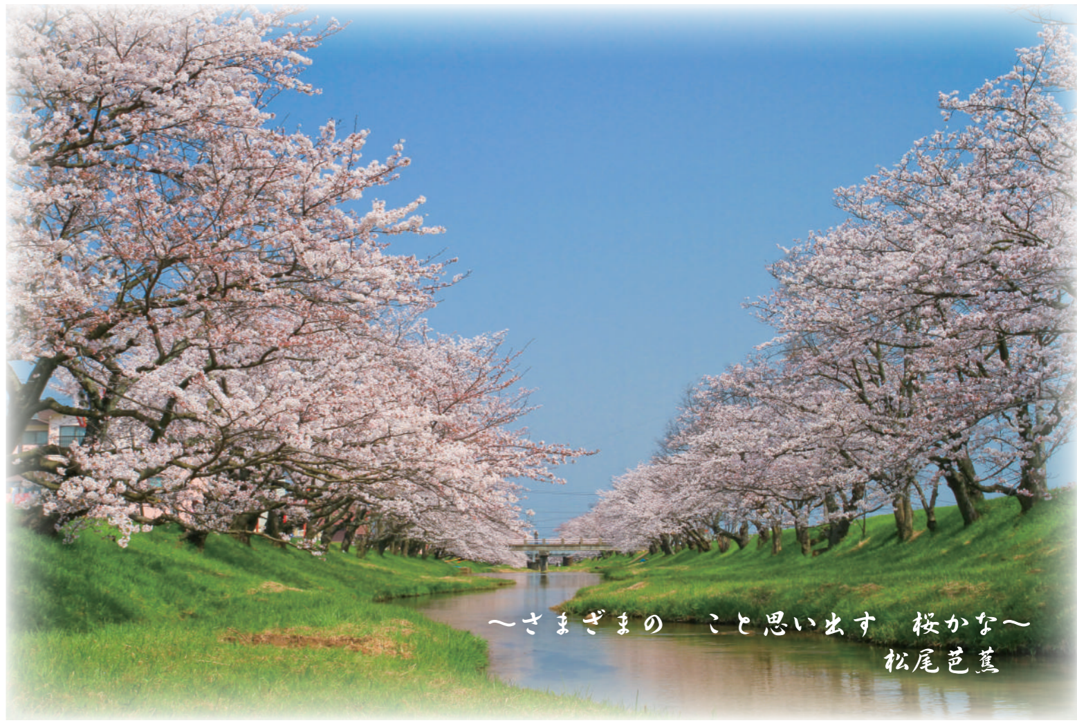
～さまぎまの こと思い出す 桜かな～ 松尾芭蕉