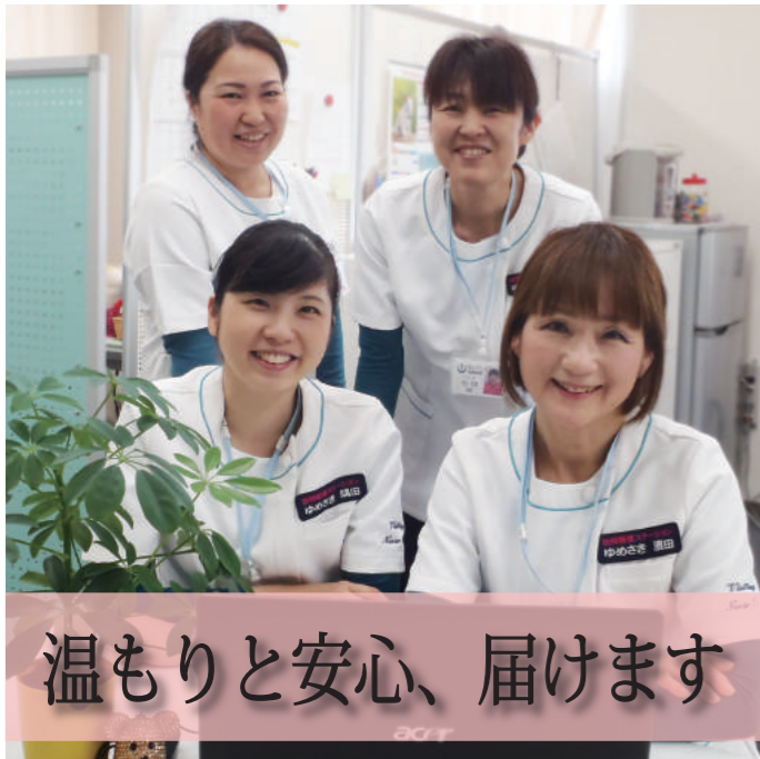
温もりと安心、届けます