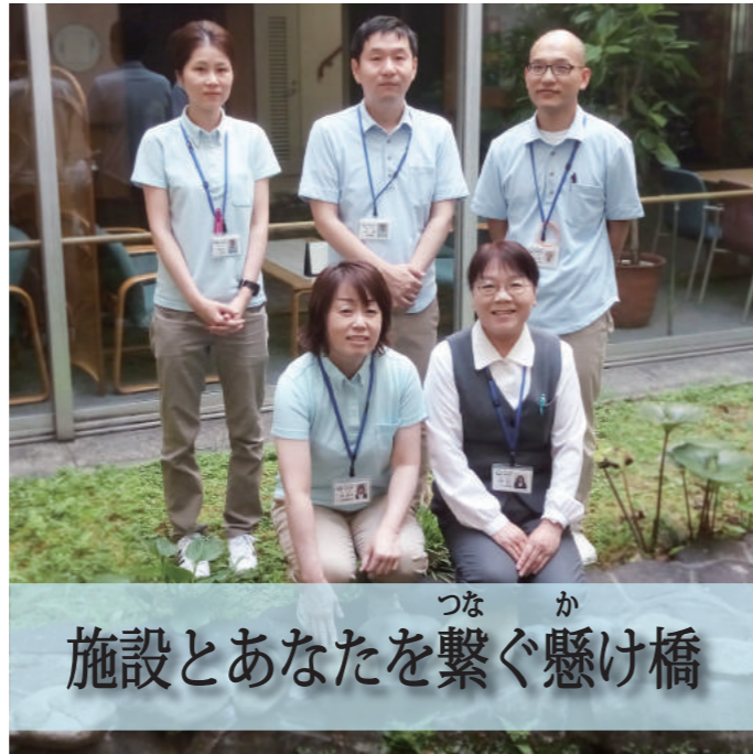
つな か 施設とあなたを繋ぐ懸け橋

グループ内の事業を活かせるようによりよい連携をとり、この地域で過ごしやすい環境を整えるための計画と一緒に考える事がケアマネジャーの大切なお仕事です。