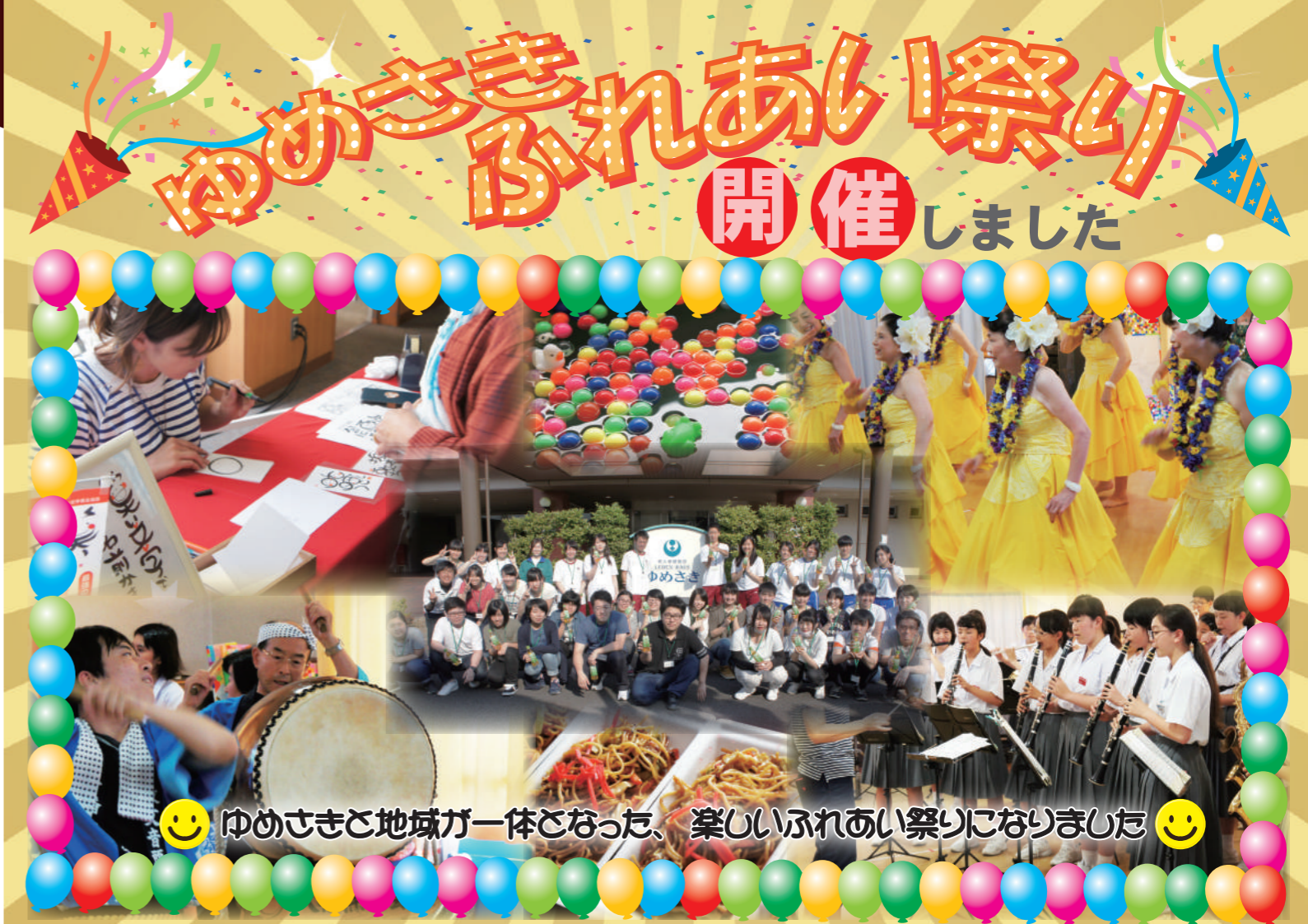
😊 ゆめさきと地域が一体となった、楽しいふれあい祭りになりました 😊

私たちはこれまでに「病棟ではなく家に帰りたい」、「住み慣れた地域で暮らしたい」という利用者様の声を耳にしてきました。そんな想いを第一に考え、ご本人やご家族をサポートすることで自宅療養実現のお手伝いをしたいと考えています。また看取りも含めて、ご本人が最期までその人らしく生活できるようにお一人お一人に寄り添った看護で支援させていただきます。